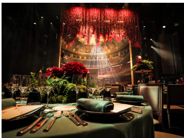
Dîner sur scène